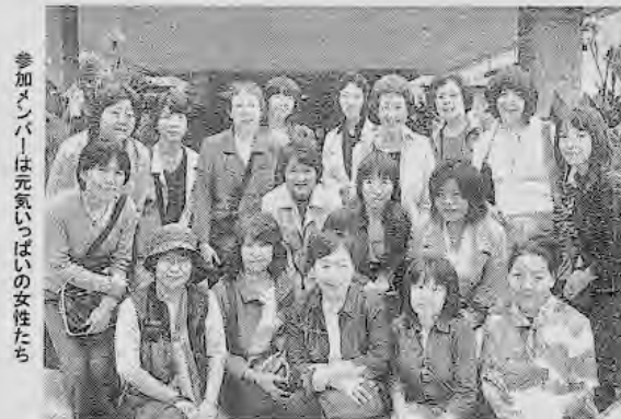
参加メンバーは元気がいっぱい女性たち